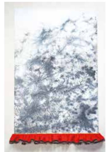
Goddess Uksáhká, Outi Pieski