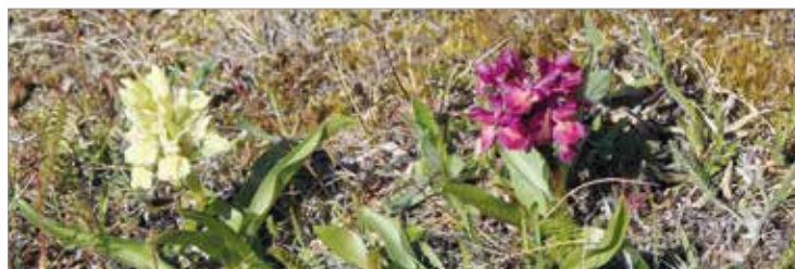
En av arton orkidéarter: Adam och Eva.