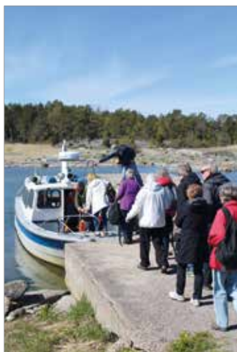
Passbåten från Gräsö.