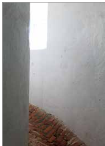
Vägen upp och fyrens innersta hemlighet.